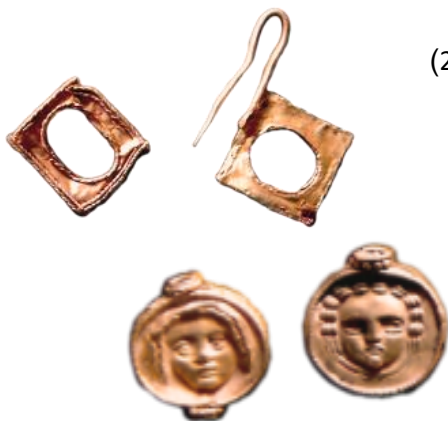
صورة رقم (26)