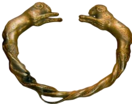
صورة رقم (32)