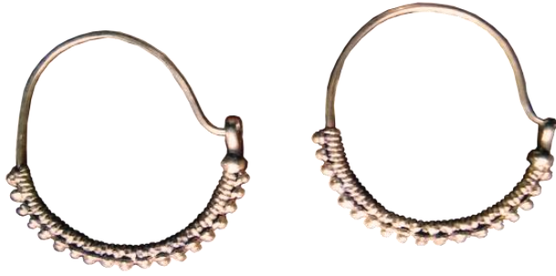
صورة رقم (36)