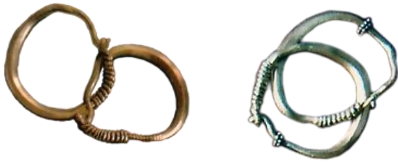
صورة رقم (37)