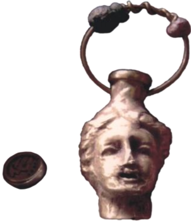
صورة رقم (39)