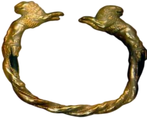
صورة رقم (33)