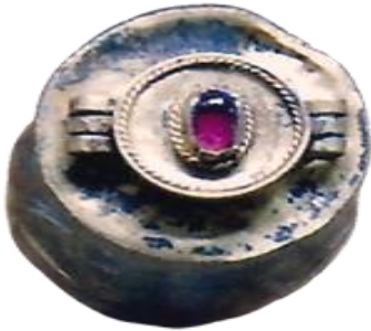
صورة رقم (24)