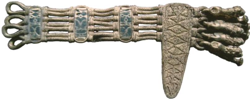
صورة رقم (27)