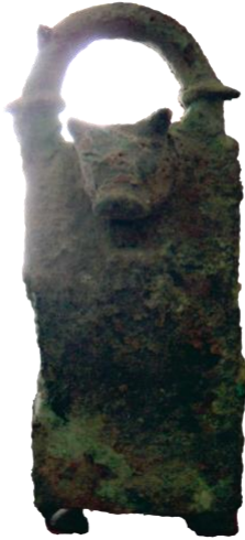
صورة رقم (21)