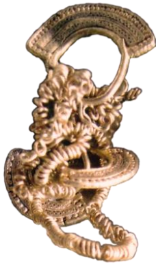
صورة رقم (38)