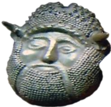
صورة رقم (25)