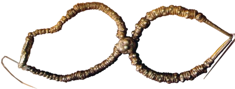
صورة رقم (34)