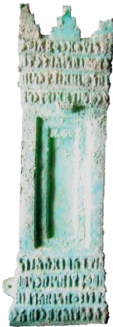
صورة رقم (22)