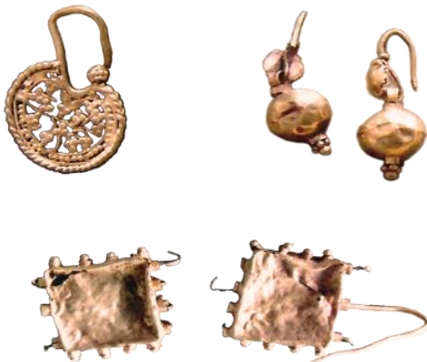
صورة رقم (35)