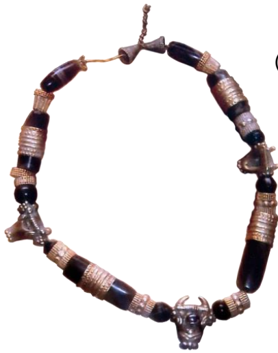
صورة رقم (30)