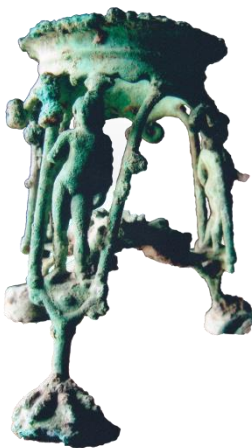
صورة رقم (23)