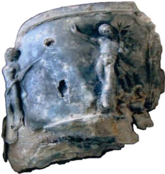
صورة رقم (40)