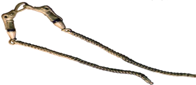
صورة رقم (29)