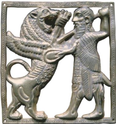
صورة رقم (28)